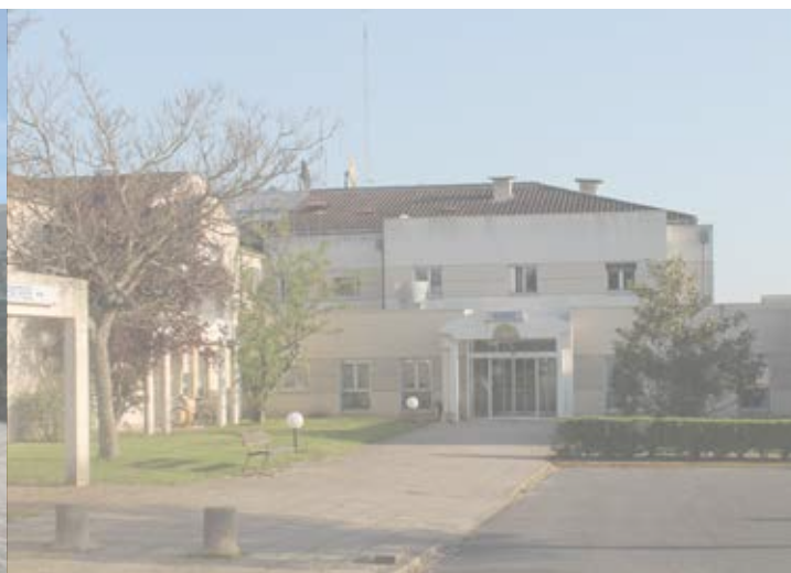
Site de Parthenay