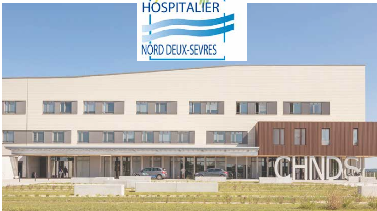
Site de Faye l'Abbesse