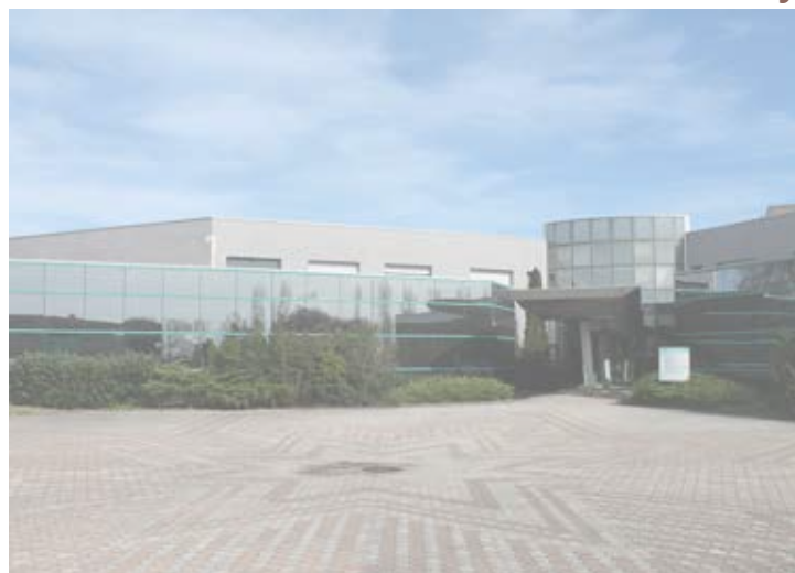
Site de Thouars